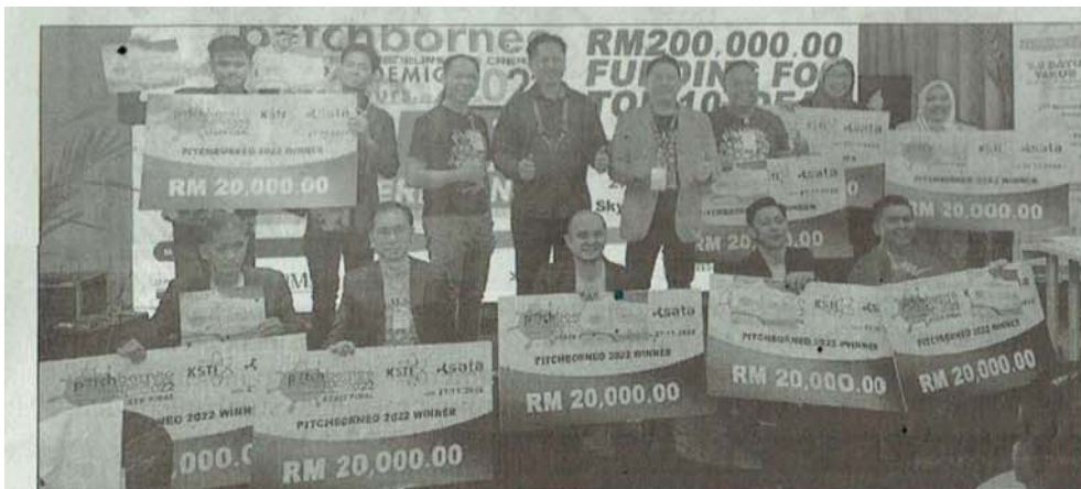
PEMENANG Pitch Borneo 2022 bergambar bersama selepas majlis itu.